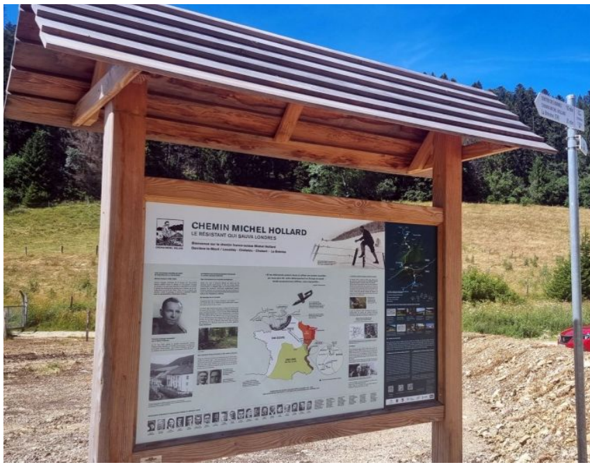
Ferme du vieux Chateleu